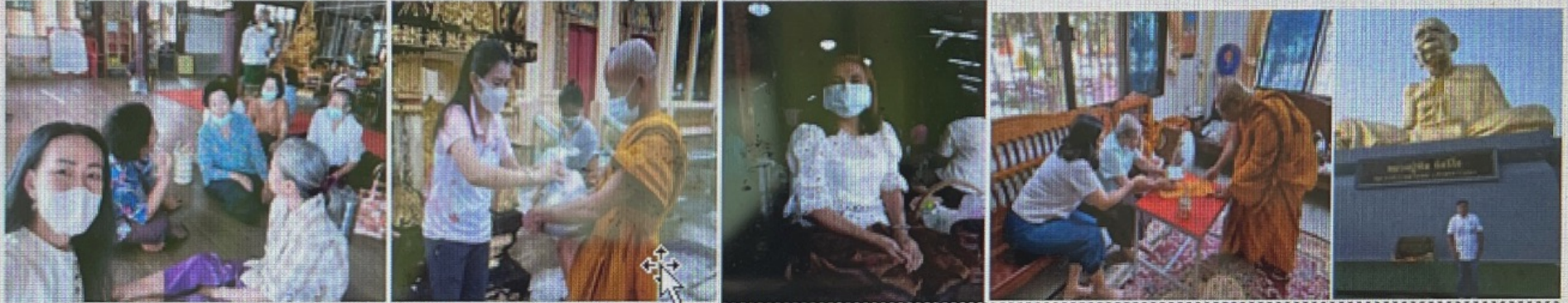
๒.๑ ทำบุญตักบาตรวันพระ และวันสำคัญทางศาสนา เช่น วันมาฆบูชา เวียนเทียน ๒.๒ ทอดผ้าป่าสามัคคี